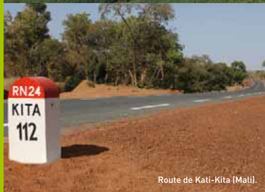
Route de Kati-Kita (Mali).