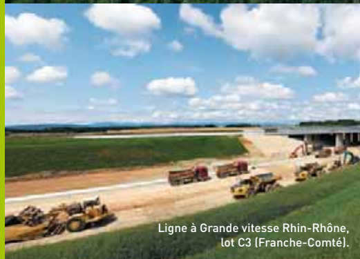
Ligne à Grande vitesse Rhin-Rhône, lot C3 (Franche-Comté).