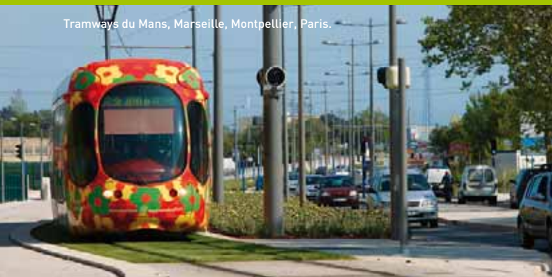
Tramways du Mans, Marseille, Montpellier, Paris.

... génie civil, terrassement, travaux souterrains, qualitatif et environnement.