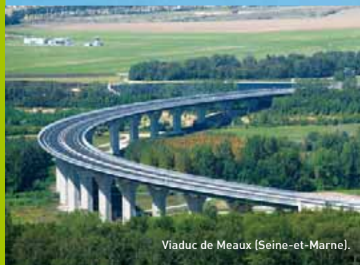
Viaduc de Meaux (Seine-et-Marne).

Pour réaliser les travaux dans des conditions optimales, RAZEL maîtrise les coûts de réalisation et suit de façon rigoureuse les délais d'exécution fixés dans les marchés. Face aux aléas, RAZEL réagit rapidement et s'adapte aux nouvelles conditions de travail.