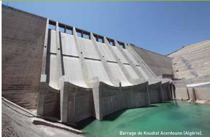
Barrage de Kouidiat Acerdoune (Algérie).

RAZEL met à disposition ses moyens en personnel et matériel pour mener à bien les différents travaux sur l'ensemble du territoire national. Ainsi, une équipe spécifique accompagne les clients dans la réalisation de leurs projets.